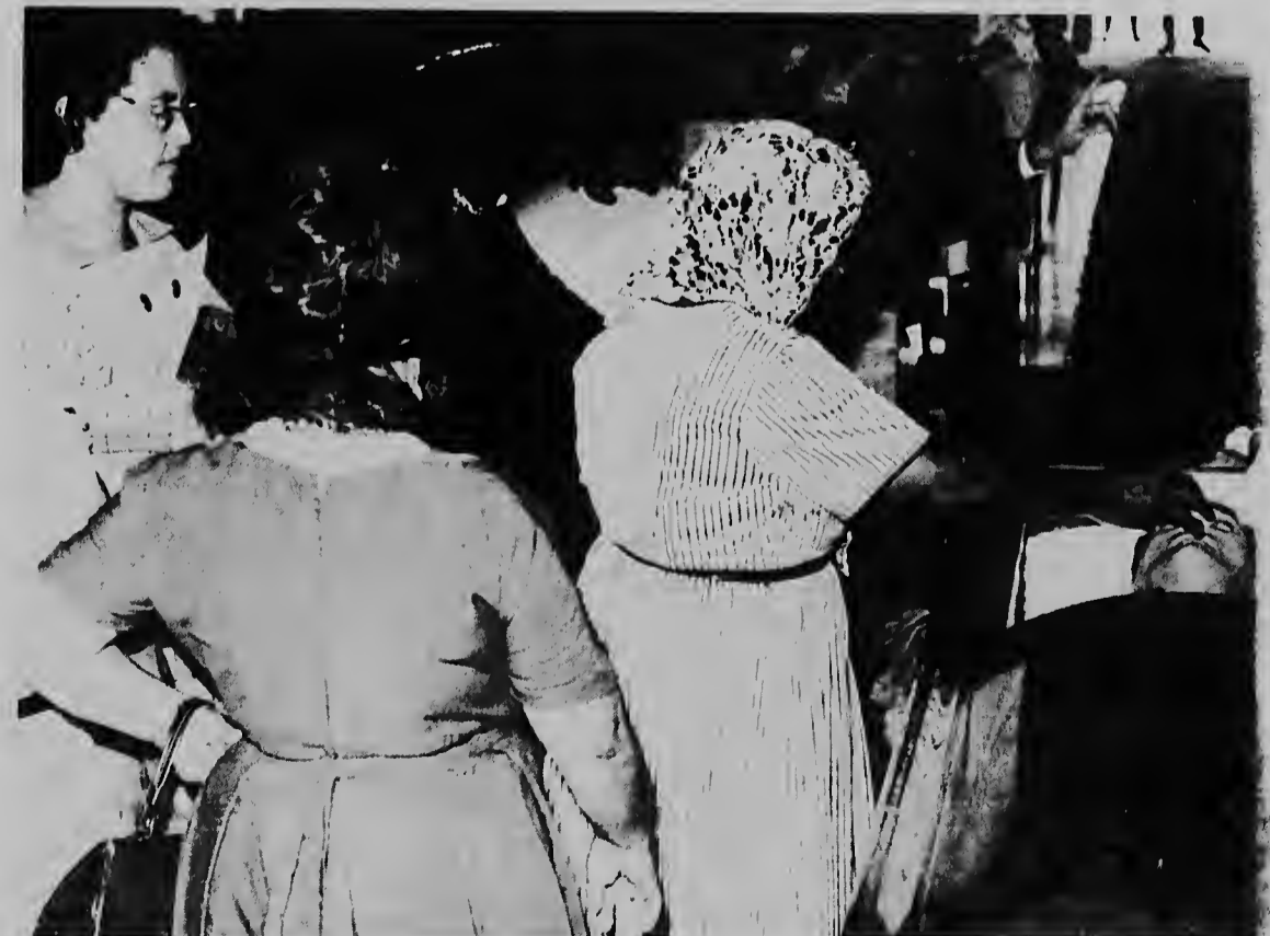
Joven y bieu tabata desfila ajera tardi dilanti di e caha di morto di e fallecido politico Shon A. Eman. Hopi di nan, tantu dama como caballero, no por a domina nan lagrimanan na momento cu ne tabata despedi di e lider politico aki.